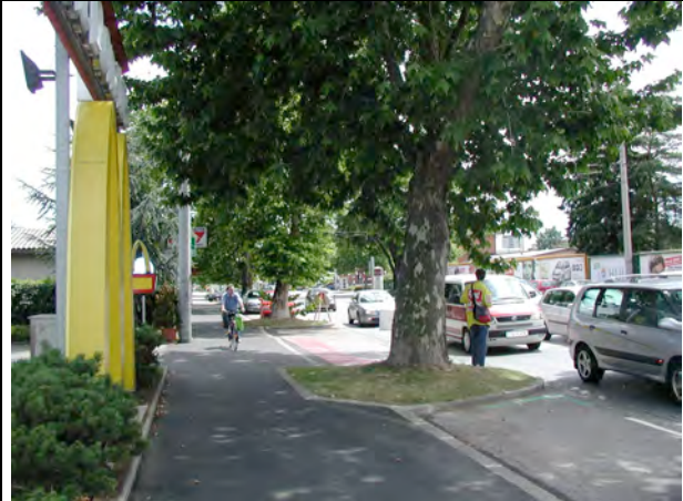
Engstelle Geh/Radweg Conrad-von-Hötzendorfstr.